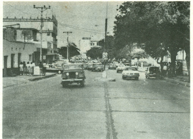
ACTUAL CARRERA 46

de distintas épocas cuanto más potencias hayan sido las aspiraciones de quienes creyeron aportar buenas ideas de una nueva arquitectura y un buen urbanismo.