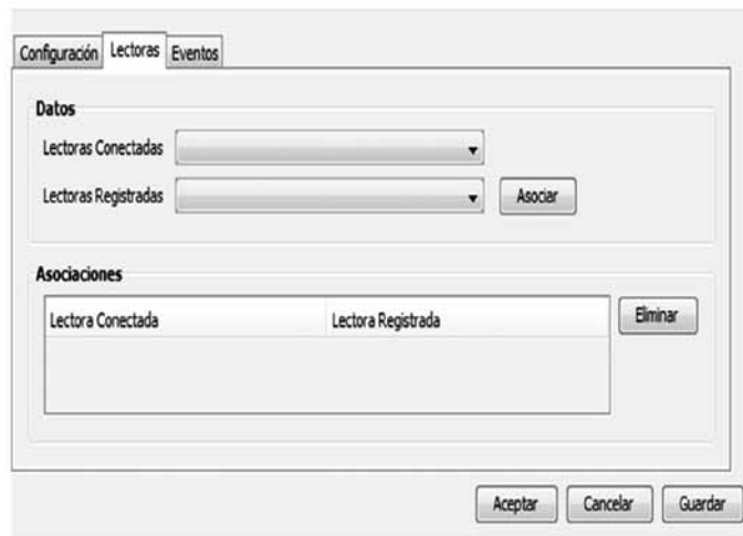
Figura 3. Pestaña de Configuración del Servicio de Lectoras (Configuration tab Readers Service)