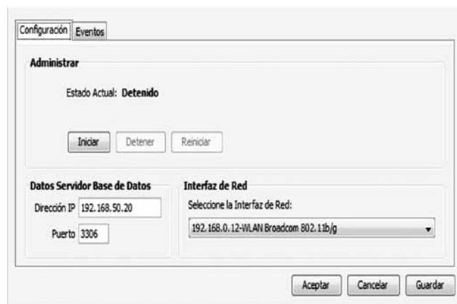
Figura 4. Servicio AAA. (AAA Service)

Este servicio está desarrollado con el fin de autenticar el usuario y carné que viene de la petición del servicio de lectura; decide bajo ciertos parámetros, además de sus permisos, si permite o no el ingreso y además registra el resultado en la base datos. Una vez que el usuario es autorizado, el servicio establece la comunicación con el panel para la transmisión del pulso que activa las cerraduras. Este proceso se da gracias a que el servicio de lectura envía información del dispositivo lector y mediante ciertas asociaciones el servicio AAA halla el relé que se debe activar. La figura 4 muestra la interfaz del servicio AAA.