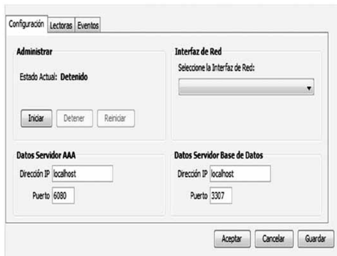
Figura 2. Pestaña de Configuración del Servicio De autenticación (Settings tab Authentication Service)

En el contexto de la solución, los dispositivos lectores [13] están conectados a una computadora. Esta máquina debe alojar el servicio de lectura, el cual valida la información de la tarjeta para su posterior envío al servidor de control de acceso, aunque previamente, se deben relacionar las lectoras conectadas a esta máquina con las lectoras registradas en la base de datos de JACAS ; de este modo cuando los usuarios inserten su carné en el dispositivo lector, se abrirá la puerta que corresponde a ese punto de acceso (ver figura 2 y 3).