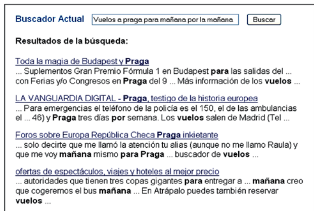
Figura 3. Resultados utilizando la Web Semántica