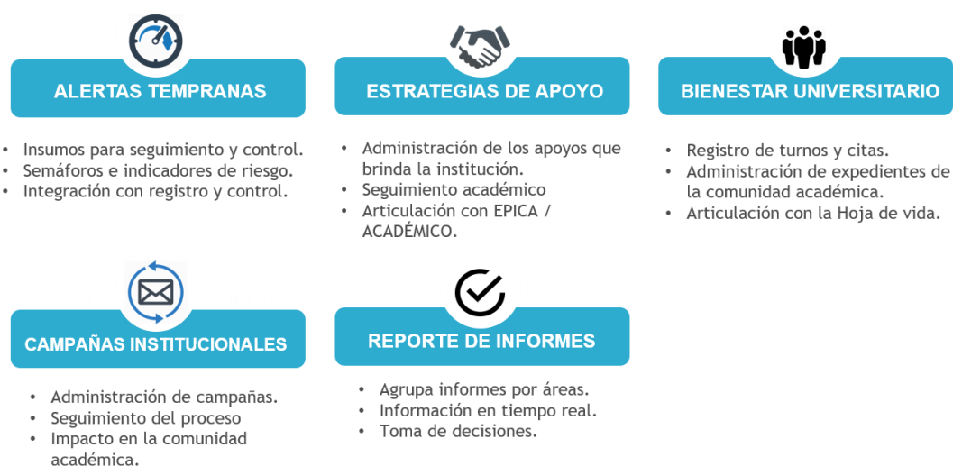
Figura 4. Diseño de la solución.