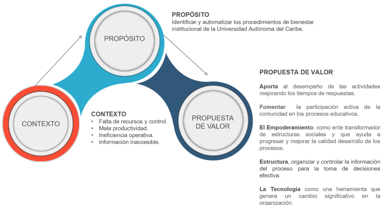
Figura 2. Justificación de la Investigación

En adición a la adopción de nuevas tecnologías, los analistas predicen que la prosperidad futura de las naciones y organizaciones en este nuevo entorno caracterizado por el uso intensivo de la información dependerá tanto de su habilidad para innovar como de su capacidad de ajustarse al cambio (TECNOLOGÍA E INNOVACIÓN: IMPACTO EN LA COMPETITIVIDAD, pág. 12).